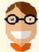
Il porte des lunettes