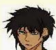
un petit nez