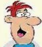
un gros nez